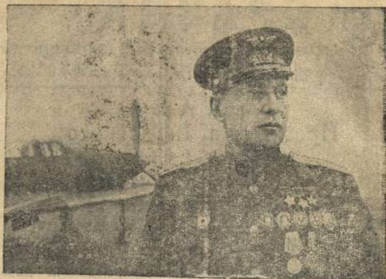
Трижды Герой Советского Союза гвардии полковник А. И. Покрышкин.