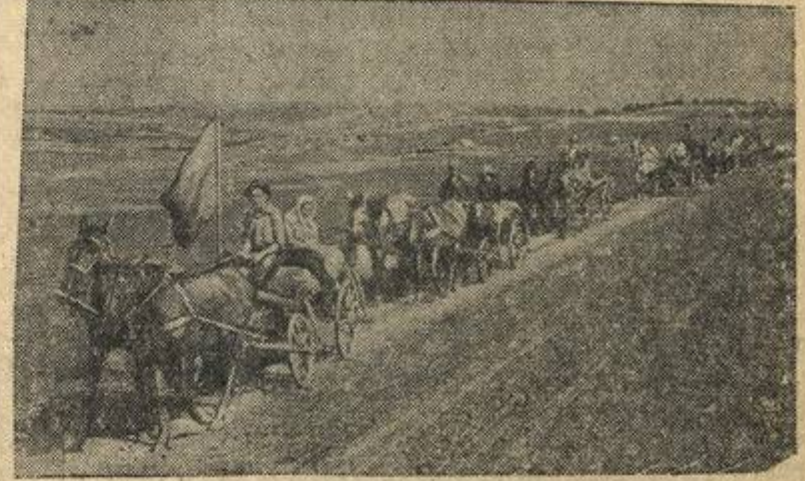
Крестьяне села Табаны, Бричанского района, Бельянского уезда, Молдавской ССР, везут хлеб государству. К годовщине освобождения Молдавии крестьяне этого села полностью выполнили свои обязательства по поставкам зерна государству.