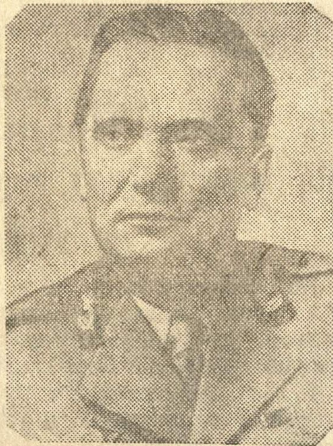
Маршал Югославии Иосип Броз Тито.

Н. БЕЛЯЕВА, Зав. отделом пропаганды и агитации РК ВКП(б).