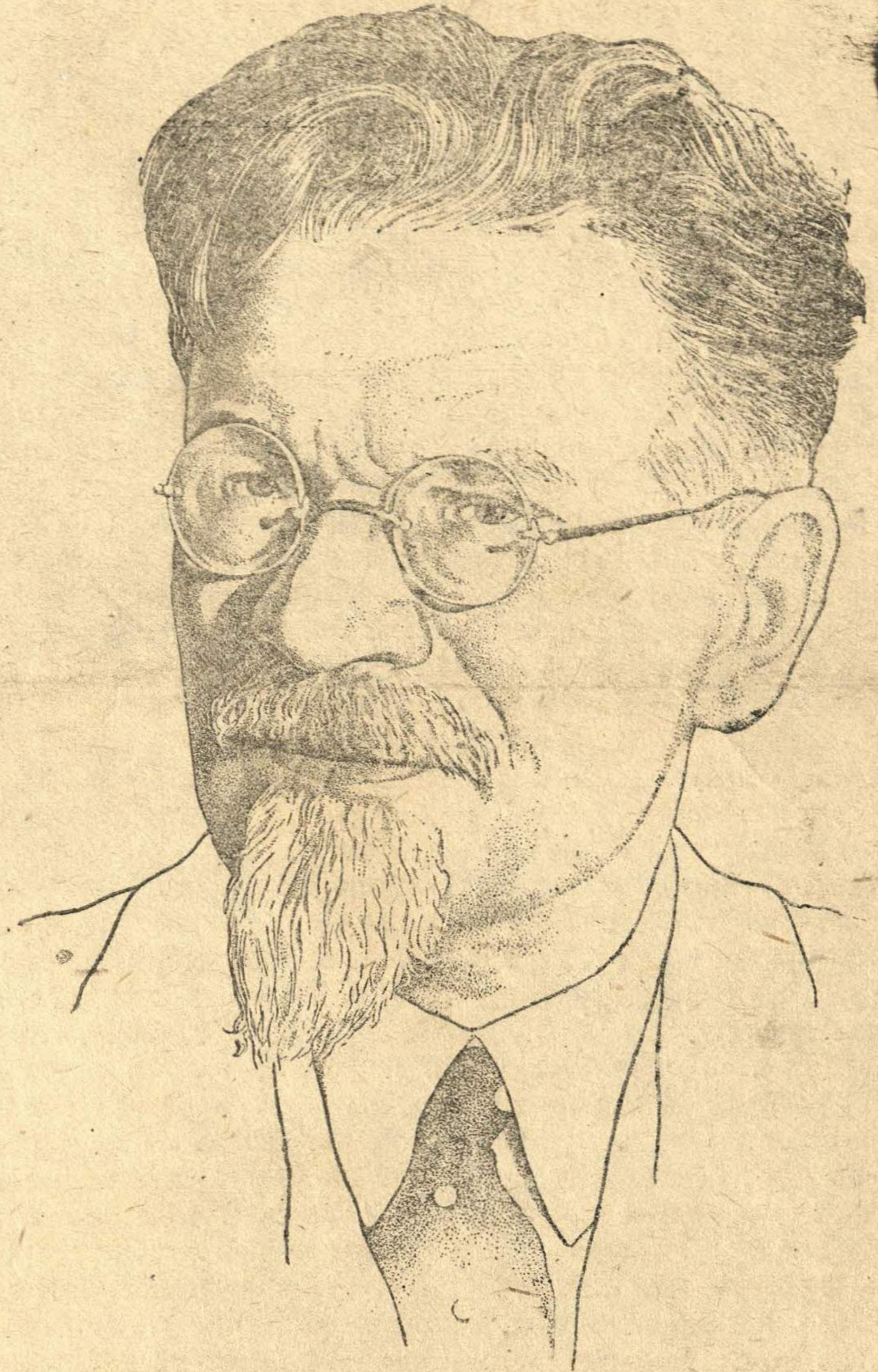
Председатель Президиума Верховного Совета СССР Михаил Иванович КАЛИНИН

19 НОЯБРЯ 1945 года ВСЯ СТРАНА ОТМЕЧАЛА 70-ЛЕТИЕ СО ДНЯ РОЖДЕНИЯ МИХАИЛА ИВАНОВИЧА КАЛИНИНА.