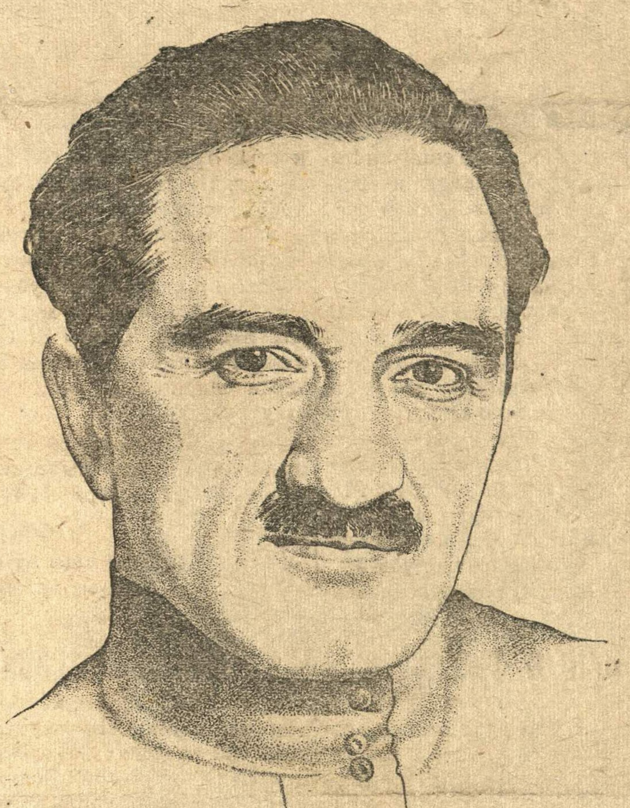
Заместитель Председателя Совнаркома СССР и Народный Комиссар Внешней Торговли Анастас Иванович МИКОЯН.

Прирост по району за 7 дней составляет всего лишь 7 проц. Как видно из публикуемой сводки, II-й Кумохинский, Аржановский, Чучелихинский и Пестовский не дали ни одного процента прироста, хотя выполнение плана сдачи льнопродукции государству в этих сельсоветах не превышает 10 процентов. Руководители колхозов и сельсоветов должны приложить все усилия к тому, чтобы в соревновании за выполнение плана льнопоставок участвовали все звенья и бригады, добиться, чтобы годовой план сдачи льнопродукции государству был выполнен к 15 декабря.