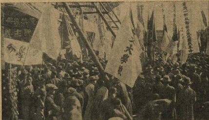
ДЕМОНСТРАЦИЯ КИТАЙСКИХ СТУДЕНТОВ