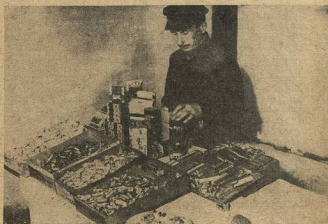
ХОРОШЕЕ ПРИМЕНЕНИЕ ДЛЯ СОВЕТСКОГО СПЕЦИАЛИСТА, НА КОТОРОГО ГОСУДАРСТВО ПОТРАТИЛО ТЫСЯЧИ РУБЛЕЙ...

— Враки! Не может быть! Ведь всем известно, что нам требуется очень много врачей!