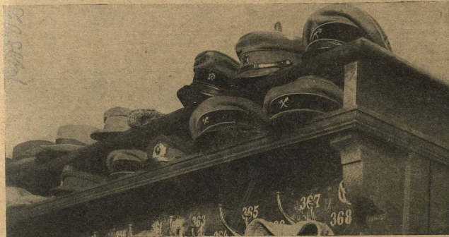
В ВСНХ 600 ИНЖЕНЕРОВ...