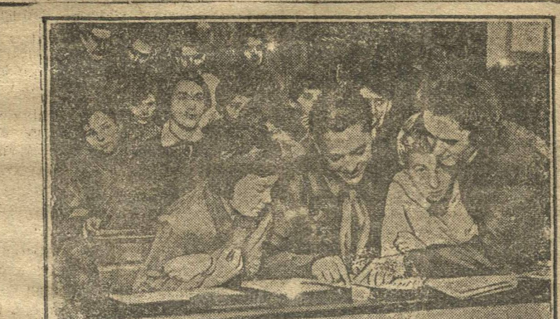
В сельской школе.

Сумеем возглатить активность рабочих В начале развертывания коллекторной кампании бюро комсомольского коллектива вместе с активом Учебно-промышленного комбината имени Ленина вынесло целый ряд практических мероприятий по проведению кампании и участия в ней комсомольцев. Для проверки старого коллекторного соглашения были созданы специальные тройки, развертывая работу среди рабочих своего цеха. В работе проверочных бригад активное участие принимали комсомольцы. После проверки выполнения старого коллекторного соглашения цеховые проверочные работы на пленуме фабкома фабрично-заводской организации приступили к подготовке коллекторного на новый хозяйственный год. В новый коллекторный поступило 200 рабочих предложений.