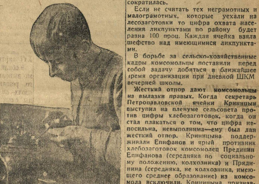
Школа ФЭУ телефонного завода имени Ленина.