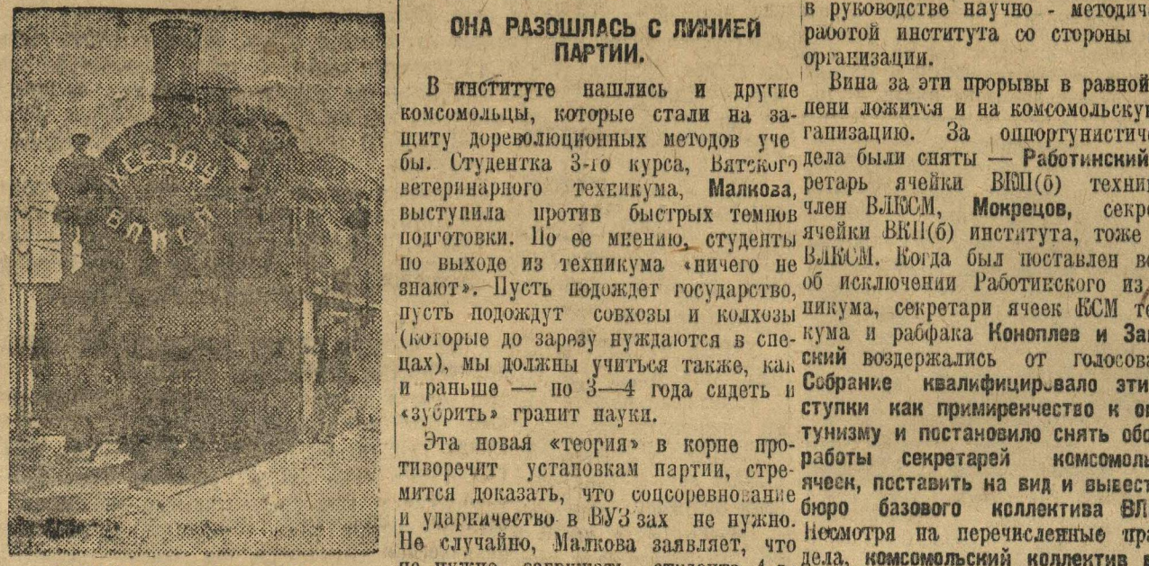
Она разошлась с линией партии.

Силование, — говорит Григорьев, — не стало боевой работой комсомольцев ячеек района. Было дано задание заложить 38 пш., заложено только 15. Причиной слабой работы является недопонимание значения сирийки, высосанные из пальца, черноватые комсомольцы так же как и другие комсомольские организации края своей работой разбирали в пух и прах. Твердо решив выполнить большевистские дела, поставленные перед комсомолом ленинской партией задачи, черноватые комсомольцы выработали конкретный план действий, брошенный своим силам на места в села и деревни своего района. Из районного актива было создано 13 бригад. Бригады сумели мобилизовать массы вокруг вопроса хлебозаготовок. Был организован выход по деревням, целью которого было разяснительная и организационная работа по доведению до местного населения плана хлебозаготовок. До первого ноября районная комсомольская организация своими силами сумела организовать 12 красных обозов. На районной конференции комсомола заслушав рапорта организаций, ячеек о том, как они добивались выполнения планов хлебозаготовок, деле-