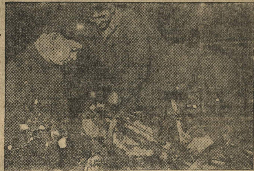
К IX С'ЕЗДУ КОМСОМОЛА. Комсомольская производственная коммуна слесарей — одна из лучших ударных бригад завода.