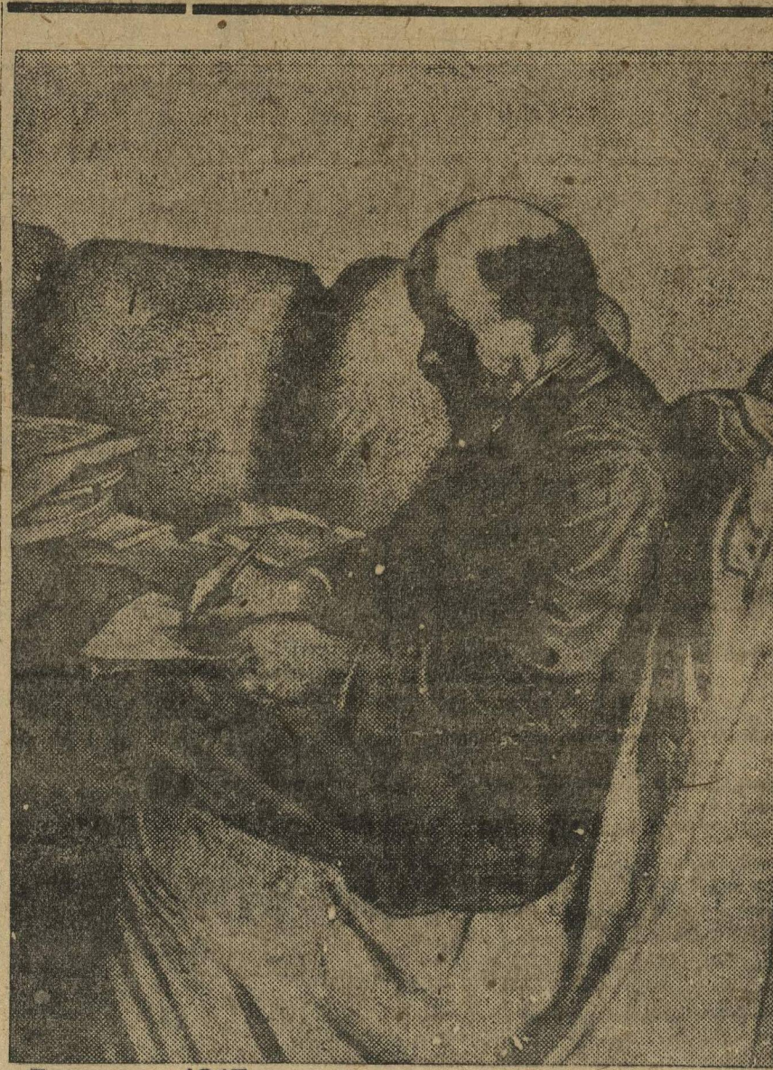
Ленин в 1917 году

Мы с восторгом гордимся тем, что являемся современниками и учениками Ленина. На каждом шагу практики международного пролетарского движения, при решении всякого, сколько-нибудь важного вопроса сегодняшнего дня, мы еще и еще раз обращаемся к оставшемуся им огромному наследству и каждый раз находим там все новые практические указания. Его работы, как работы Маркса и Энгельса, не стареют. Печать гения лежит на каждой, написанной Лениным, странице. Мы по праву гордимся тем, что являемся его учениками.