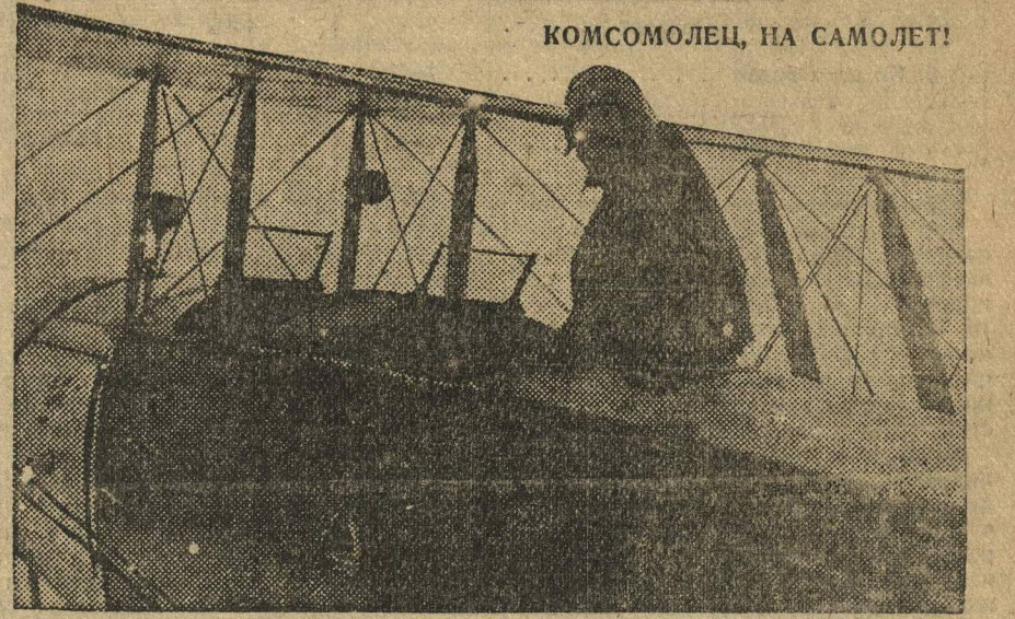
КОМСОМОЛЕЦ НА САМОЛЕТЕ!