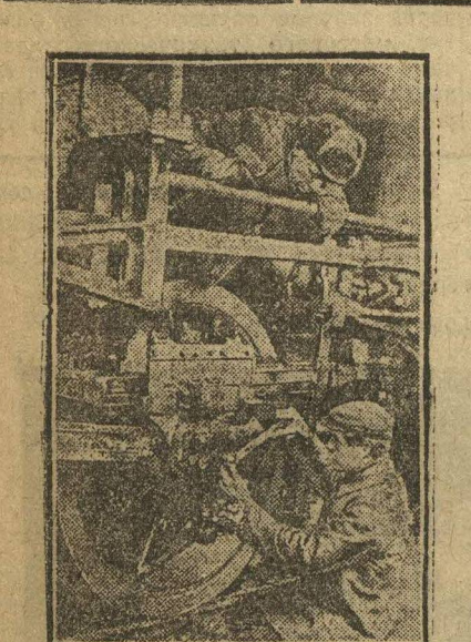
УДАРНИКИ НА ТРАНСПОРТЕ.