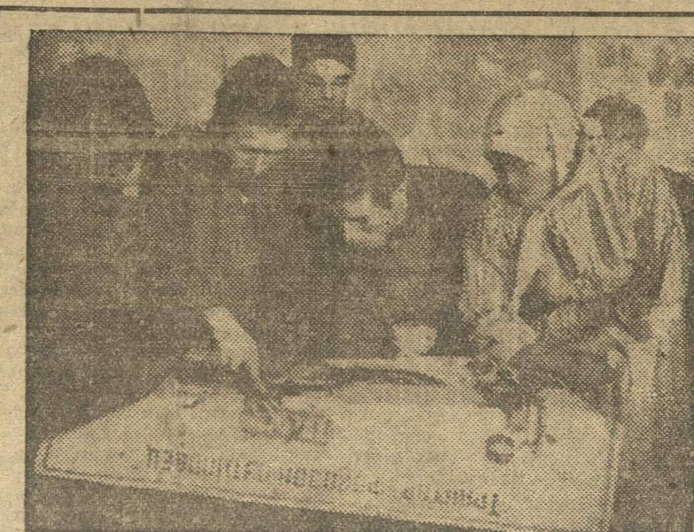
На курсах трактористов в гор. Канаше (ЧАССР).

Во многих деревенских ячейках справиться с громадной политической задачей задачи чрезвычайной трудности. Здесь должны прийти на помощь деревни, на помощь колхозу — город, завод, на помощь колхозным и деревенским ячейкам КСМ — ячейки заводов и фабрик.