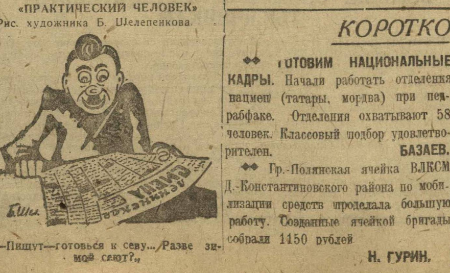
Рис. художника Б. Шелепикова.

Комсомольская организация Удмуртской области отмечает XIII годовщину своего существования. За период 13 лет комсомол УАО прошел суровую школу классовой борьбы, борьбы с правыми и «левыми» оппортунизмом, идя под руководством парт-организации, в передовых шеренгах социалистического наступления области. Начиная с 1921—22 года в комсомольской организации УАО началось массовый приток в комсомол рабочей и крестьянской молодежи. Если в начале 1921 года в организации насчитывалось всего 1491 чел., то к 1924 году организация насчитывала в своих рядах 4354 чел., из них 30 проц. удмуртов. С 1925 года по 29 и почти 30 год, в связи с ростом промышленности и развития сельского хозяйства, организация ощущала резкий недостаток национальных комсомольских кадров. Из года в год в Удмуртской области развивается тяжелая индустрия. Идет перестройка сельского хозяйства на социалистический лад. Даже в глухих удмуртских уголках организуются колхозы и товарищества по общественной обработке земель. В связи с ростом коллективизации в области усилилась террористическая деятельность кулачества. Кулаки организуют поджоги, похищения (удмуртская) и т. д. Классовая борьба находила свое отражение и в комсомоле, куда прорезались кулаки, которые разжигали классовую вражду. Под руководством ЦК и Крайкома ВЛКСМ комсомольская организация в борьбе за генеральную линию партии, в борьбе на два фронта очистилась от классово-чуждых элементов, идейно выросла: получила классовую боеспособность ленинских рядов.