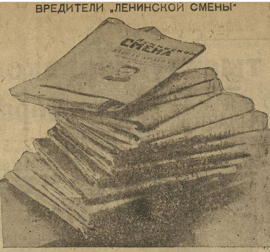
ДИЗЕЛЬНЫЙ ЦЕХ ЗАВОДА «КРАСНОЕ СОРМОВО». КОМСОМОЛЬСКАЯ ПЕЧАТЬ, НЕДОСТАВЛЕННАЯ ПОДПИСЧИКАМ.

В с. Армадеи при помощи учителя комсомольца организован колхоз из 8 хозяйств. Председателем правления колхоза избран учитель.