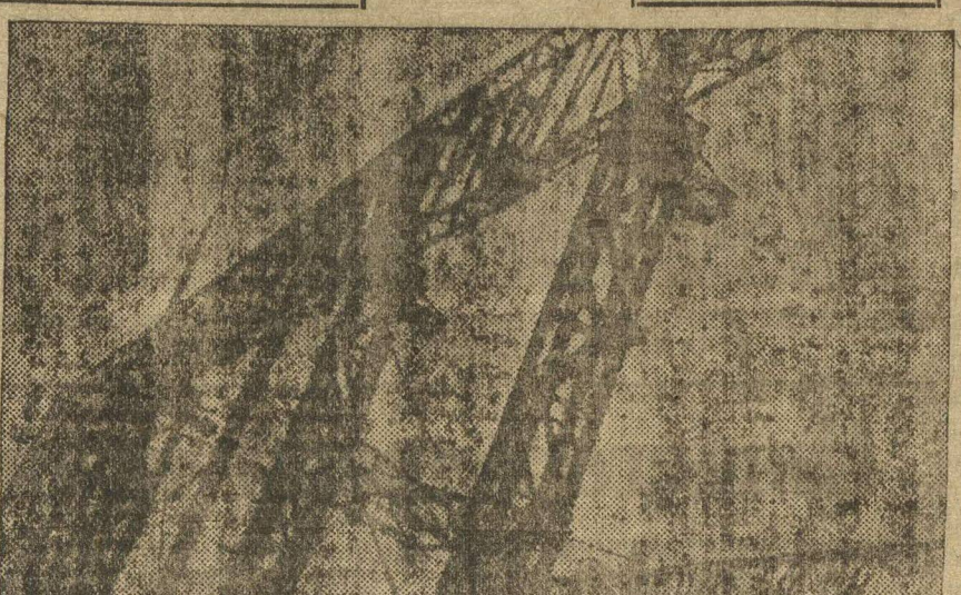
НЕ ФОТО—КРЕПЛЕНИЕ МЕТАЛЛИЧЕСКИХ КОНСТРУКЦИЙ. РАСШИРЕНИЕ МЕХАНИЧЕСКОГО ЦЕХА «КРАСНОГО СОРМОВА».

Промышленным же в крупных районных центрах (Вятка, Ижевск, Араганас, Муром, Семенов и др.) надо также выдвигать художественные бригады.