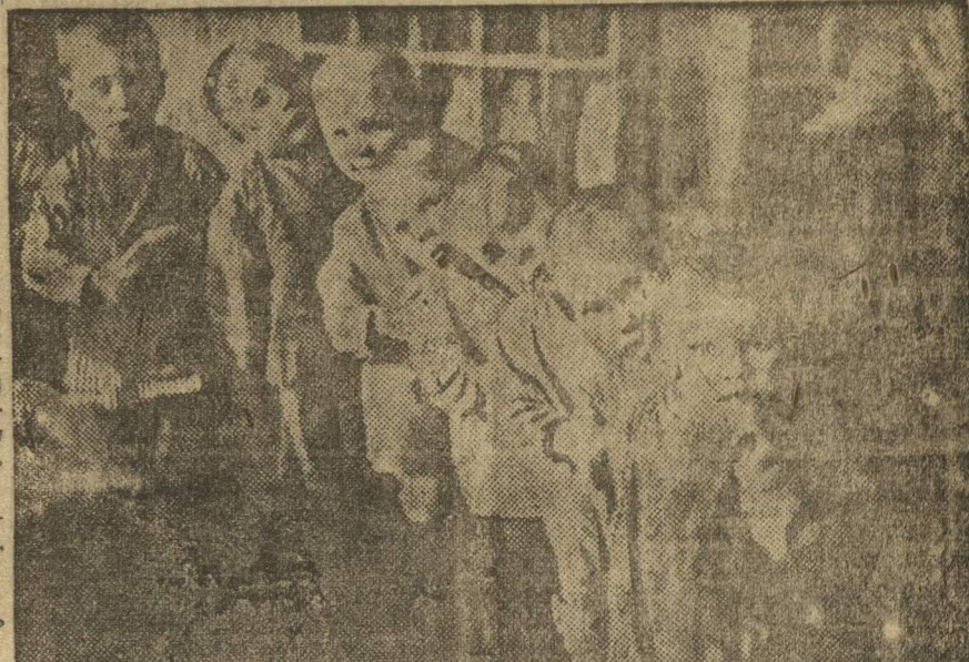
В 50 деревнях от Москвы, в деревне Именино и Головино еще в 1929 г. организован колхоз из 27 хозяйств...