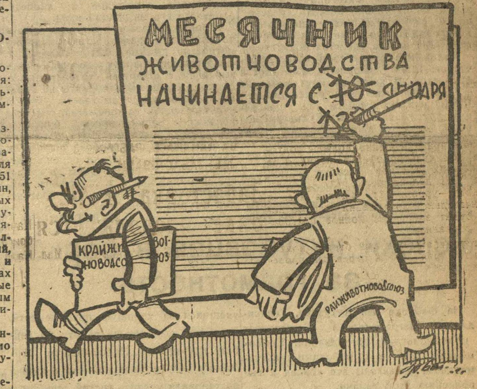
Месячник животноводства начинается с 10 января

Следующий номер «Ленинской Смены» выйдет 17 февраля