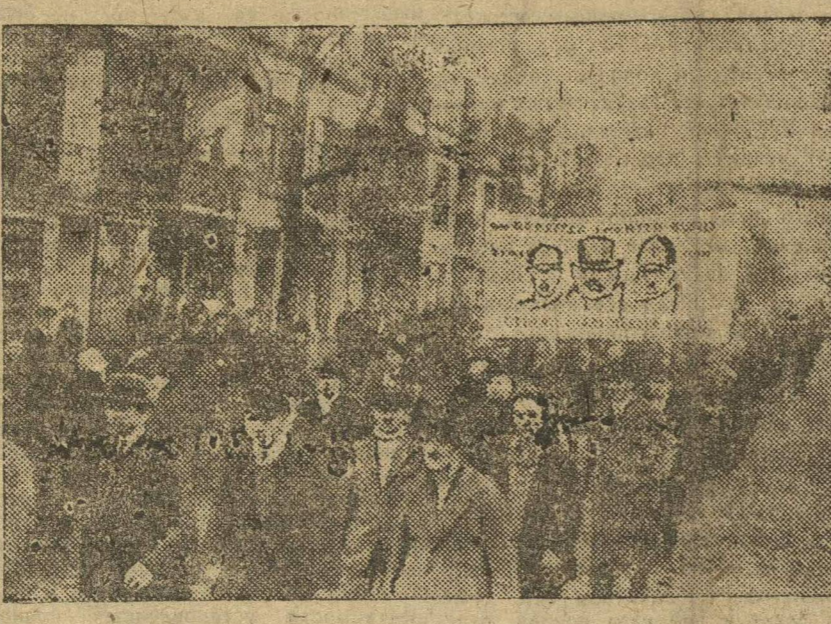
25-1-1931 г. в Гамбурге состоялся массовая демонстрация против наступления фашизма. НА СНИМКЕ: агитпрограмма на демонстрации.

БЕРЛИН, 13. На массовом рабочем собрании, организованном революционной профсоюзной организацией, штеттинские портвенные рабочие постановили объявить забастовку. По всему порту расставлены массовые стачечные пикеты. ВСЕ РАБОТЫ В ПОРТУ ПРЕКРАЩЕНЫ. Реформисты призывают к штрейкбрехерам, ссылаясь на то, что забастовка объявлена революционной профсоюзной организацией. СВЫШЕ ТЫСЯЧИ ПОРТОВЫХ РАБОЧИХ ГАМБУРГА БАСТУЮТ. На массовом собрании бастующих центральный стачечный комитет сделал доклад о деле борьбы. Реформисты путем запугивания пытаются разбить фронт бастующих. На собрании 1400 портовых рабочих БРЕМЕНИ ПРИНЯТО ЕДИНОГЛАСНОЕ РЕШЕНИЕ ОБ ОБЪЯВЛЕНИИ ЗАБАСТОВКИ.