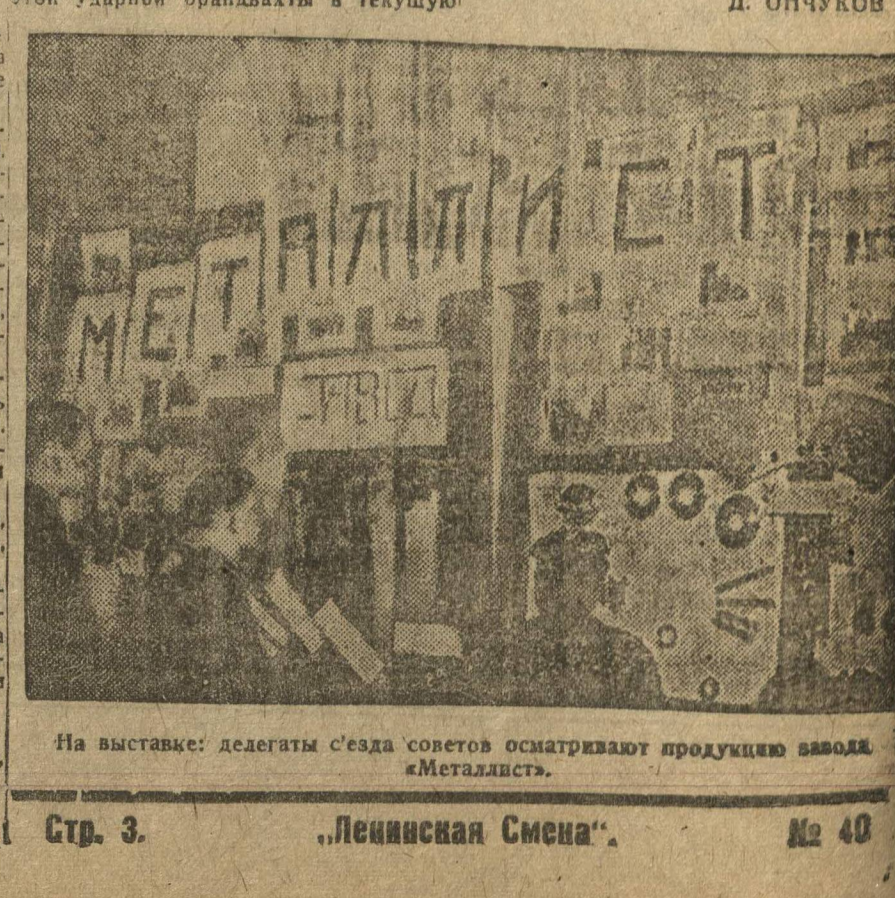
На выставке: делегаты съезда советов осматривают продукцию завода «Металлист».

Сорновская судострой. Бригада «Лен. Смены». 12 февраля 1931 года.