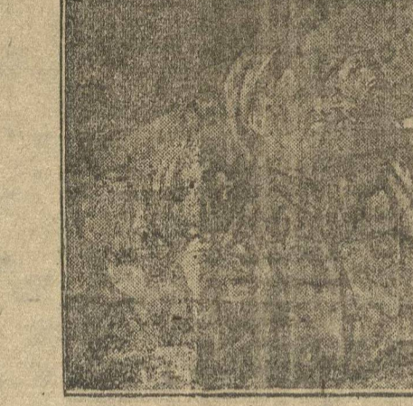
В связи с приближением головкины Красной армия, рабочие завода «Красный Богатырь», в Москве, объявили себя ударниками-сообрахивщиками.

Волжскому государственному речному флоту, в навигацию 1931 года дано задание перевести груза 39 миллионов тонн, пассажирских перевозок 21 млн.