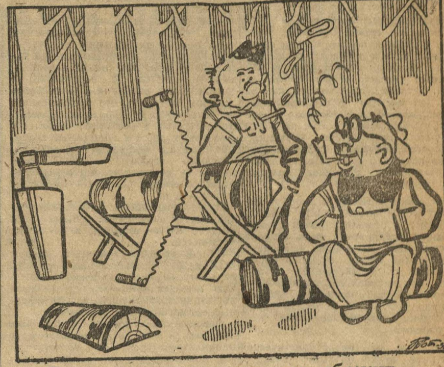
Дело не волк, в лес не убежит...

План особенно четвертого 1931 г. по заготовке деловой древесины выполнен только на 14 проц: дров — на 20 проц, и угля — на 56 проц. Нет должного перелома на лесозаготовках и в настоящее время. Квартальное задание на 10 февраля по заготовке деловой древесины выполнено на 13 проц, дров — на 13,4 проц, и угля — на 24 проц.