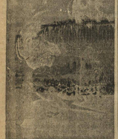
В с. Хохол, Гремяческого р-на, ЦПО 1 февраля пущена электрическая станция. Лампочка Ильича осветила 900 из колхозников. Село Хохол коллективизировано на 80 проц. В бригаде «Лен. Смольный» — КАРГАЛОВ и КОЛОБЯНИН.