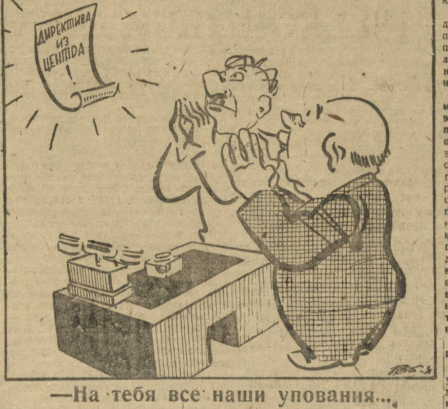
— На тебя все наши упования...

Ряд хозяйственных организаций в отношении февральского набора в ФЗУ и ШУМП, ведут выжидательную политику, — это скажет центра.