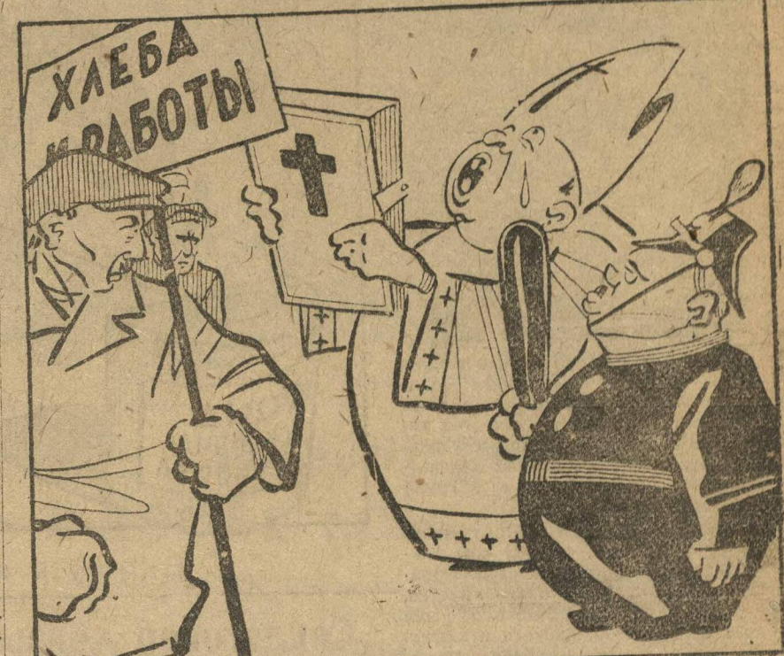
... а БЕЗРОПОТНЫМИ стараемся сделать мы