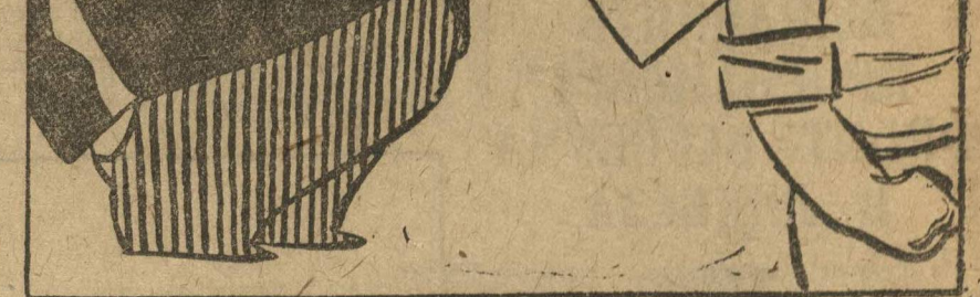
БЕЗРАБОТНЫМИ их делаем мы...

Пособие по бедности: 9 марок 87 пфеннигов на семь дней. Что означает эта сумма? Плата за квартиру — 5 марок. 2 хлеба — 1 марка. 250 грамм колбасы — 1 марка. Маргарин — 1 марка. Мыльце, мыло, трамвая, мелкая починка платья — 1 марка 87 пфеннигов. О горячем питье, а лучше — о горячем