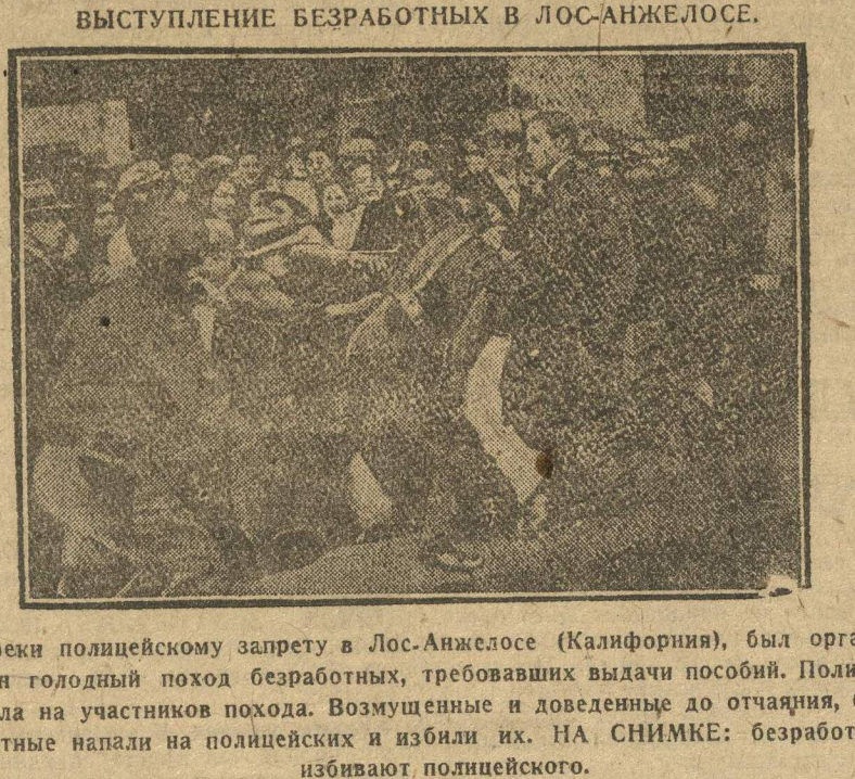
Выступление безработных в Лос-Анжелесе.

Вопреки полицейскому запрету в Лос-Анжелесе (Калифорния), был организован годовой поход безработных, требовавших выдачи пособий. Полиция напала на участников похода. Возмущенные и доведенные до отчаяния, безработные напали на полицейских и избili их. НА СНИМКЕ: безработные избивают полицейского.