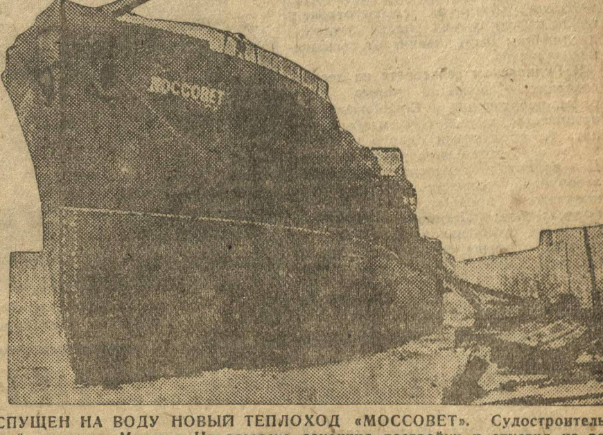
СПУЩЕН НА ВОДУ НОВЫЙ ТЕПЛОХОД «МОССОВЕТ». Судостроительный завод им. Марти в Николаевске, закончил постройку и спустил на воду новый большой теплоход «Моссовет». НА СНИМКЕ: теплоход «Моссовет».

Ходатайствуем о выпуске нового займа. Выпустить заем «Третий, решающий год пятилетки». ВЕТЛУГА (Нижгород). Призыв рабочих Горловки о выпуске нового займа имеет третий, решающий год пятилетки, подхвачен партийными ячейками района. Кооперативная ячейка уже подписала на 1630 рублей. Сейчас ведется подготовительная работа по продвижению займа в широкие массы. Комсомольский коллектив металлургов с правительством с ходатайством о выпуске нового займа «3-й, решающий год пятилетки», решил до конца подписаться на этот заем в размере месячного отката (4800 руб.). На 22 февраля 31 года подписка достигла 3550 рублей. В. ПАВЛОВСКИЙ. Редакционный коллектив работничков «Ленинской Смены» поддерживает ходатайство горловских рабочих перед правительством о выпуске займа «3-й, решающий год пятилетки». Работнички «Ленинской Смены» досрочно подписываются на новый заем на месячный откат.