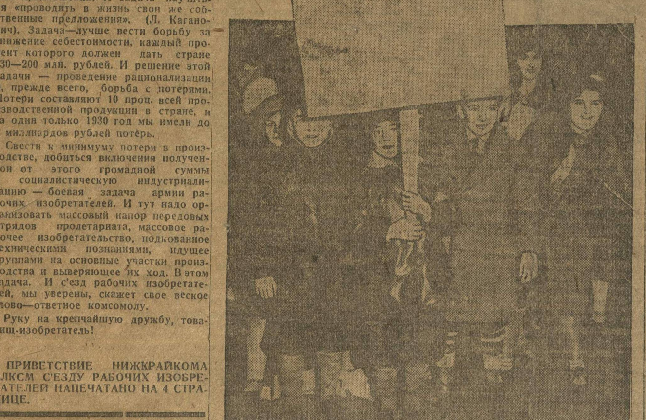
Нью-Йоркские пионеры идут в мэтисон-сквер, где происходит митинг в память Ленина. На снимке: надпись на плакате выгравирована американской цензурой.