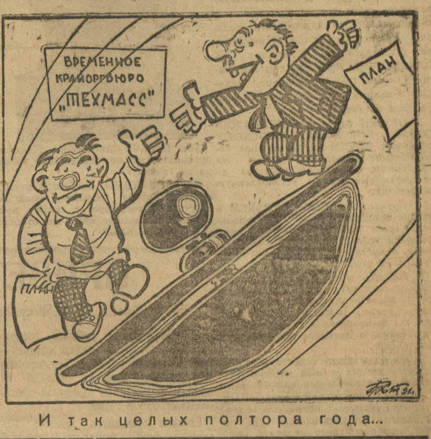
И так целых полтора года...

За 1 1/2 года своего существования временное краевое оргбюро «Техмасс» не смогло созвать краевой с'езда об-ва. Даже сейчас, когда начался массовый поход за технику, оргбюро только начинает раскачиваться. Составили бумажный план, но практических мероприятий никаких не проводится.