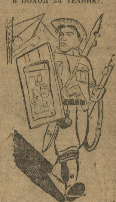
Рыцарь нашего времени