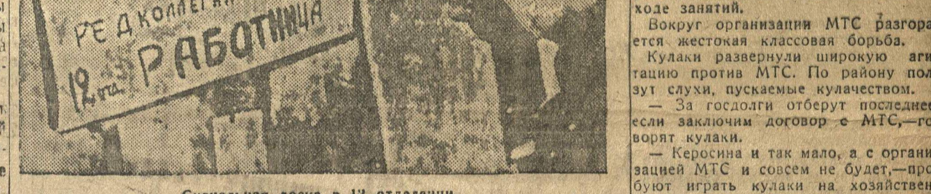
Сигнальная доска в 12 отделении.

Первое слово предоставляется тов. Мухоморову.