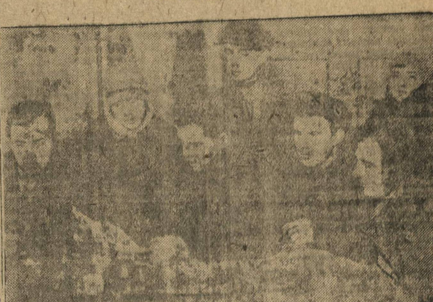
Бюро заводского комитета комсомола внесло предложение о выпуске займа «Электрификация».

Увеличилась также партийная прослойка организации. 31 лучших комсомольцев переданы в ряды партии.