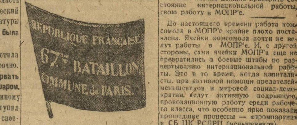
НА СНИМКЕ: знамя 67-го батальона коммуны. Знамя вдохновляло коммунаров, оно развевалось во все дни баррикадных боев в разных частях города Парижа.

18 марта мы будем отмечать 60-летие Парижской Коммуны. 60 лет тому назад впервые в истории человечества трудящиеся массы Парижа вооруженной силой захватили власть в свои руки.