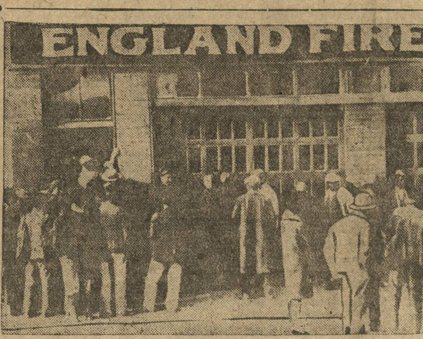
В Англии, в провинциальном городе Арканзасе, демонстрировали недавно толпы разоренных фермеров, требовавших льготы для своих семей. НА СНИМКЕ: демонстранты перед хлебной лавкой требуют хлеба.