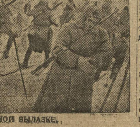
Краснодарские на лыжной вылазке.

Следующий номер „Ленинской Смены“ выйдет 19 марта