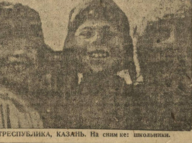
ТАТРЕСПУБЛИКА, КАЗАНЬ. На снимке: школьники.