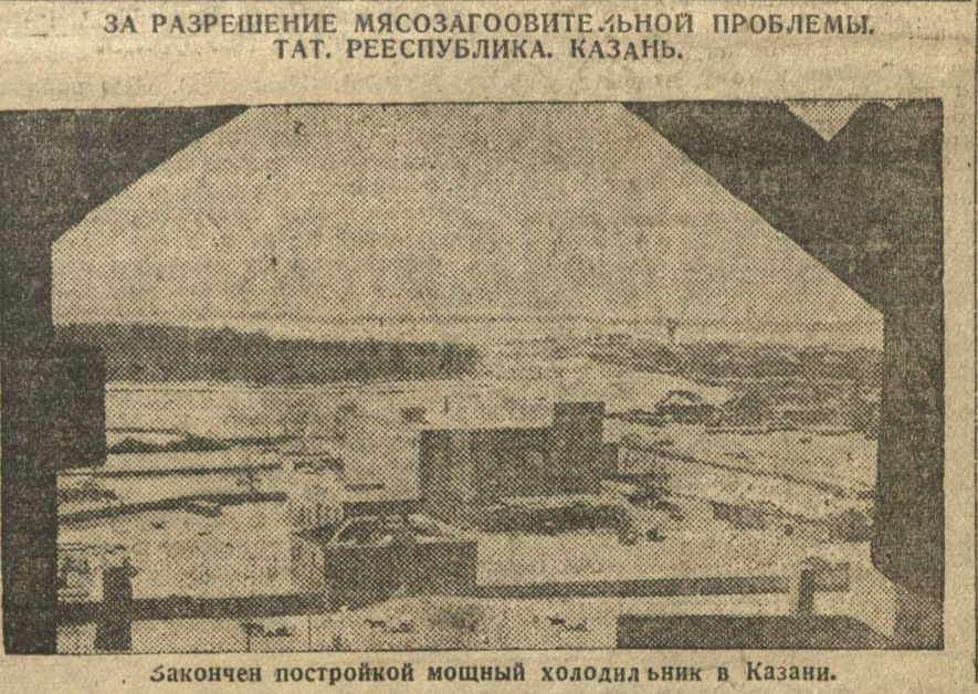
Закончен постройкой мощный холодильник в Казани.