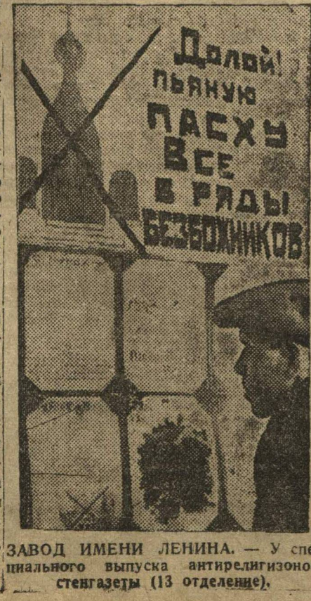
ЗАВОД ИМЕНИ ЛЕНИНА. — У специального выпуска антидемпинговой стелгазеты (13 отделеции).