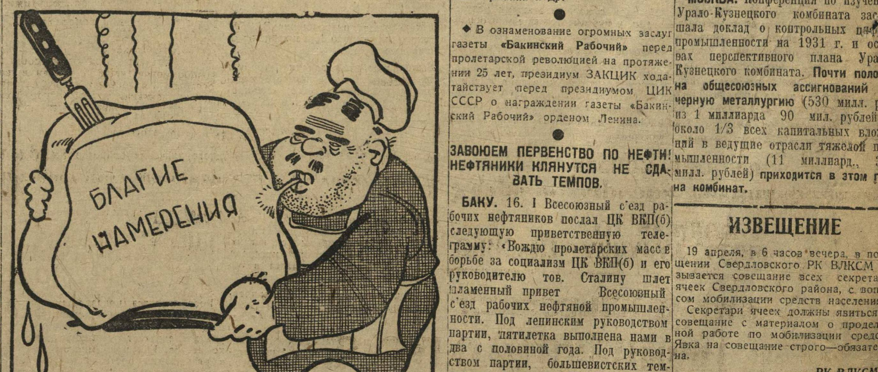
Пирог без начинки

Общественное питание продолжает оставаться одним из слабейших участков работы.