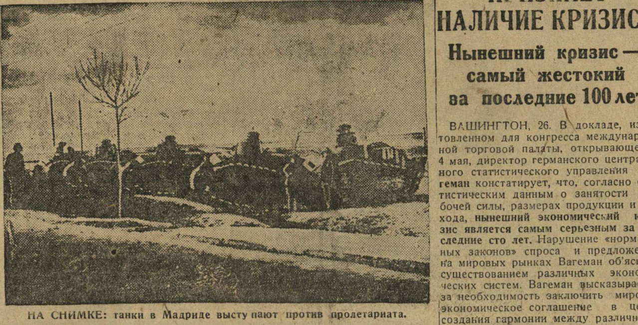
НА СНИМКЕ: танки в Мадриде выступают против пролетариата.

К Событиям в Испании. ИСПАНИЯ В ОГНЕ РЕВОЛЮЦИОННОГО ВОССТАНИЯ.