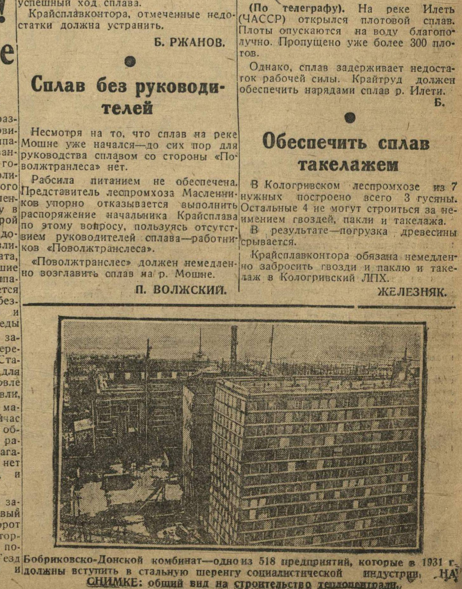
Борьковско-Донской комбинат — одно из 518 предприятий, которые в 1931 г. должны вступить в стальную шеренгу социалистической индустрии. НА СНИМКЕ: общий вид на строительство гидроэлектростанции.

ЖЕЛЕЗНЯК. Крайсплавконтра обязана немедленно забронировать гвозди и паклю и такеж в Кологривский ЛПХ.