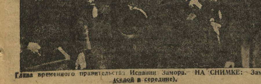
Глеба временного правительства Испании Замора. НА СНИМКЕ: Замора (сидит в середине).