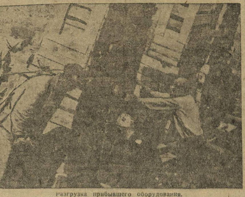
Разгрузка прибывшего оборудования.