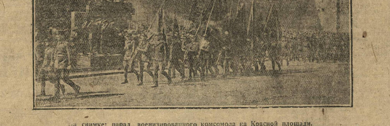
На снимке: парад военизированной комсомольской охраны на Красной площади.