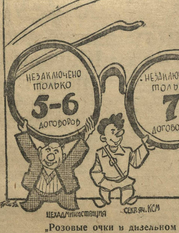
„Розовые очки в дизельном цехе“.

Предцехкома дизельного цеха завода «Кр. Сормово», заявляет, что из 27 договоров осталось незаключенными только 7. Секретарь ячейки ВЛКСМ подтверждает это. Цехадминистрация утверждает, что не заключено только 5-6 договоров. На самом деле на 8 мая из 27 договоров заключено только 8.