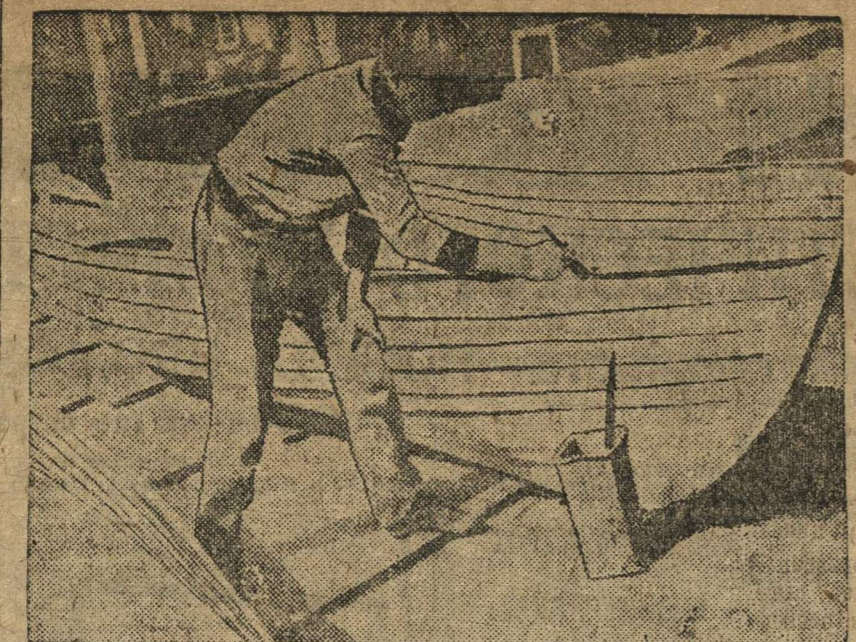
НА ВОДНОЙ СТАНЦИИ «ДИНАМО». Окраска лодок.

В 4 часа 15 мин. начинается полет. В 4 ч. 45 м. отв. секр. Крайрайкома ОАХ т. Спирidonov открывает авиационный праздник. Слово предоставляется председателю жюри, тов. Седова — 24 сек.