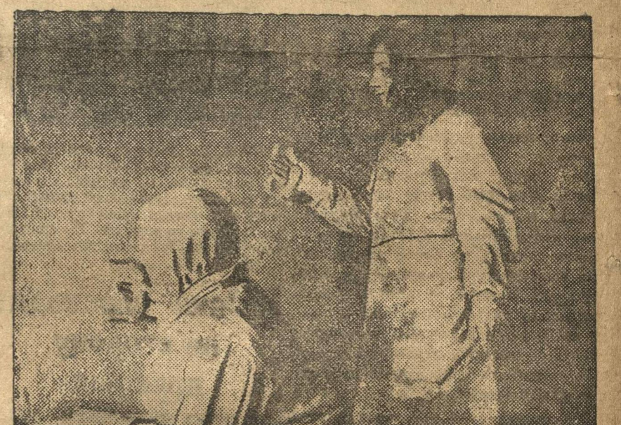
В связи с недостатком строителей Егорьевская биржа труда организовала трехмесячные курсы штукатуров и плотников. НА СНИМКЕ: женщины участвуют в строительстве.

КОТЕЛЬНОИЧ, НА ПЕРЕКЛИЧКУ Советская организация комсомола объявила с 10 апреля массовой линией поход за технику социалистического земледелия. Состоялось собрание партийно-комсомольского актива гор. Советск об организации общества «Техмасс». На собрании создано оргбюро по созыву съезда. В ячейках комсомола (Подгорная, Гор. Советск,