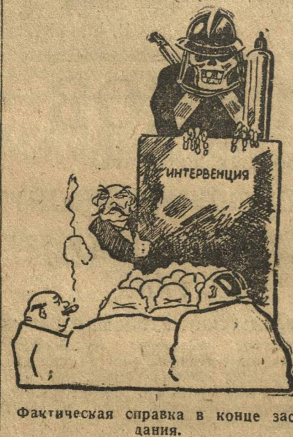
Фактическая справка в конце заседания.