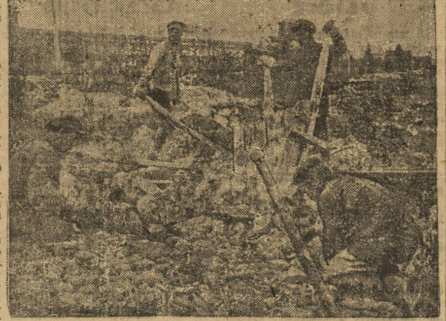
На снимке: прокладывают новую шоссеюную дорогу в совхозе.

МОЛОЧНЫЙ СОВХОЗ «ГИГАНТ» МОСПО (СЕЛО КЛЕМЕНТЬЕВО, МОЖАЙСКОГО РАЙОНА).