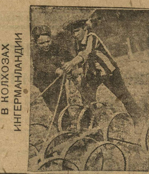
В КОЛХОЗАХ ИНГЕРМАНЛАНДИИ

Советскому комсомолу надо решительно ударить по оппортунистическому отношению к важнейшему участку кормовой базы—силосу. ВИТ. С.