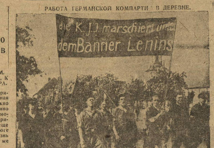
РАБОТА ГЕРМАНСКОЙ КОМПАРИИ В ДЕРЕВНЕ. Германская компартия проводит большую работу среди крестьян. Многие из производственных ячеек направляются в деревню.

Встают на пути советско-германских отношений БЕРЛИН. 29. Торгово-промышленная палата провинции Ольденбург высказалась против дальнейшего предоставления правительством гарантии для кредитования советских заказов. Правительство Ольденбурга требует, чтобы оно воздерживалось в духе реваншистской политики и на все германское правительство. В деловых германских кругах эта позиция Ольденбургской торгово-промышленной палаты вызывает резкую критику.