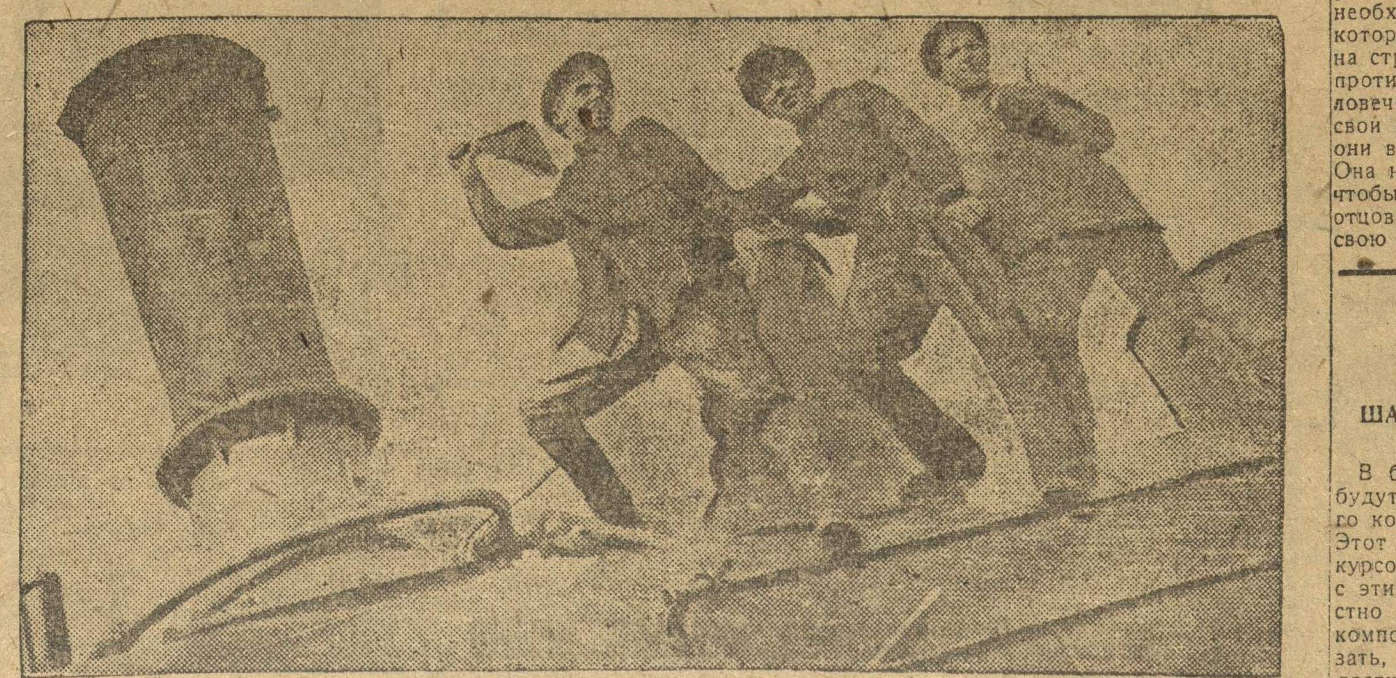
НА КОМСОМЛЬСКОМ ПАРОВОЗЕ. ФОТО-ЭТОД.