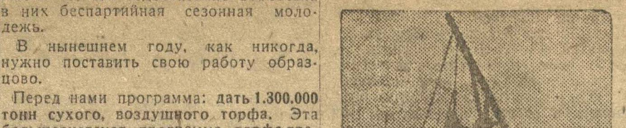
Кладка трубы (силикатный завод «Пролетарий», Канавино).