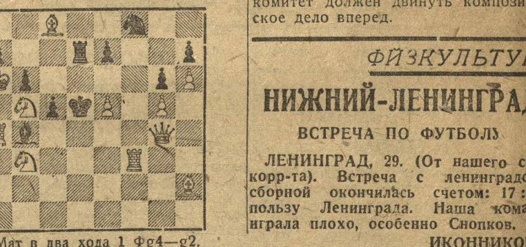
Мат в два хода 1 f4-g4-g2.