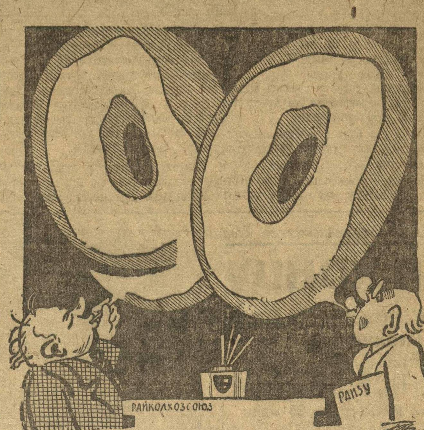
Рис. Гр. Ст.

Вожатский рай и райколхозсоюз с пеней у рта доказывали, что 90 проц. колхозов переведено на сельхозкультуру. Составлялся же агрономическое совещание выявило, что сделана по-настоящему проведена не более чем на 10 проц.