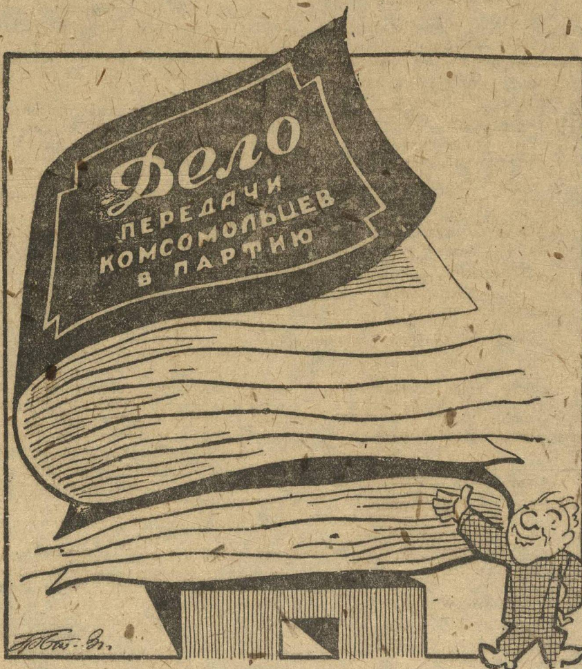
— Кто осмелится назвать меня бездельником? —

Комсомольские организации Богородска слабо работают по передаче комсомольцев в партию. Работа идет от кампании к кампании.