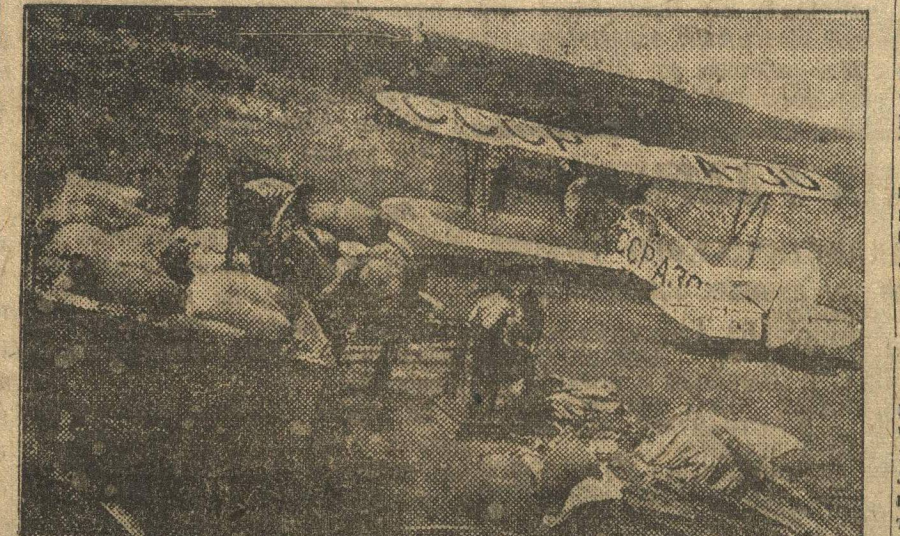
Сеяние риса с самолетов. Подвозка к аэробазе на грузовиках семенного риса.