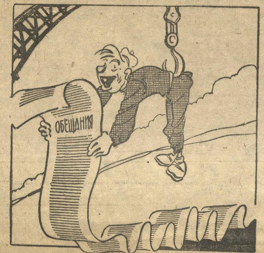
На должной высоте

Комсомольские организации Гидроторфа взяли шефство над отдельными кранами. Прошла половина сезона, но подшефные краны с выполнением заданий справляются плохо.