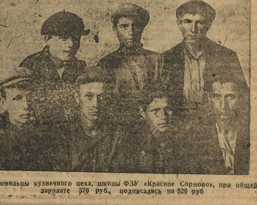
Комсомольцы кузнечного цеха, школы ФЭУ «Красное Сормово», при общей зарплате 370 руб., подписались на 520 руб.

Пышугская организация комсомола рапортует своему руководителю — Краевому Комитету ВЛКСМ и его боевому органу «Ленинская Смена», что путем мобилизации всей комсомольской общественности на дело реализации займа «Третьего, решающего года», ЗАДАНИЕ по району ПЕРЕВЫПОЛНЕНО НА 115 ПРОЦ. Собрания комсомольских ячеек, профорганизаций проходят под лозунгом: «Двухнедельный заработок — на заем». Победы на фронте мобилизации средств, которых добился Пышугский комсомол в прошлых двух кварталах, не сланы и в этом квартале. План второго квартала выполнен на 100 проц. Комсомол Пышуга переключается на выполнение и перевыполнение плана третьего, решающего квартала. Ведет нас в число первых. Райкомол ОХЛОПКОВ.