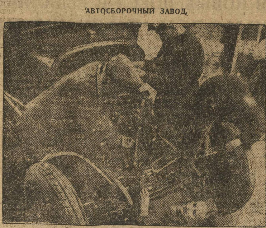
Учебная сборка машины.