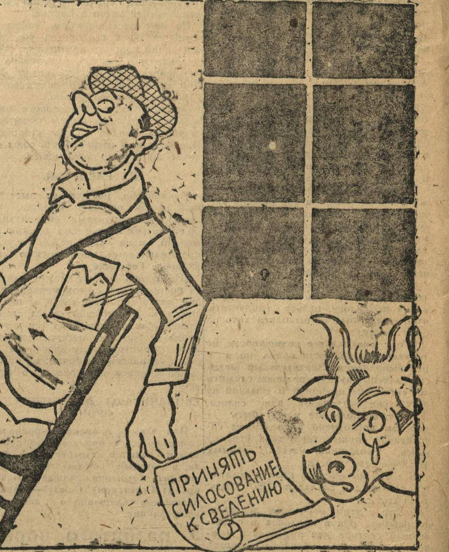
Силос, у которого сыт не будешь

Некоторые колхозы в КСМ ячейки в Лысковском районе недооценивают силосование, организовывают постановочными «прятать» силосование к сведению.