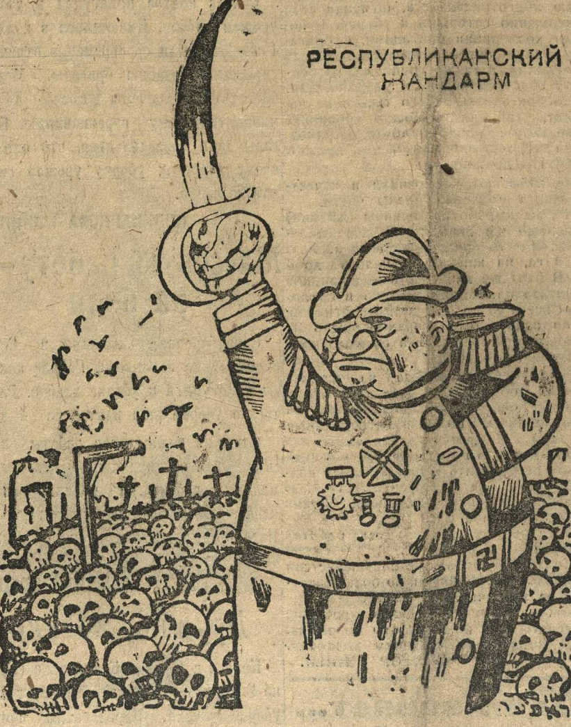
«Под его режимом население чувствует себя спокойно»

ЦК комсомола в своем постановлении предупреждал о подобных извращениях; в постановлении прямо говорится: «...решительно не допуская перегибов и извращений в росте союза, твердо помня, что дело не только в количестве, но, главным образом, в качестве».