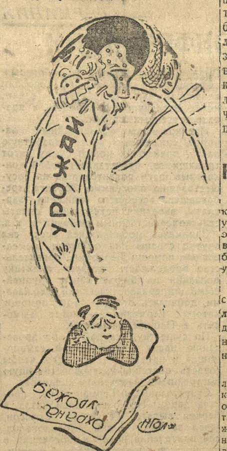
Многие из комсомола ничего не делают по охране урожая.