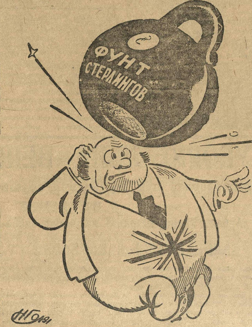
Убийственное падение фунта

Курс английского фунта стерлингов падает.