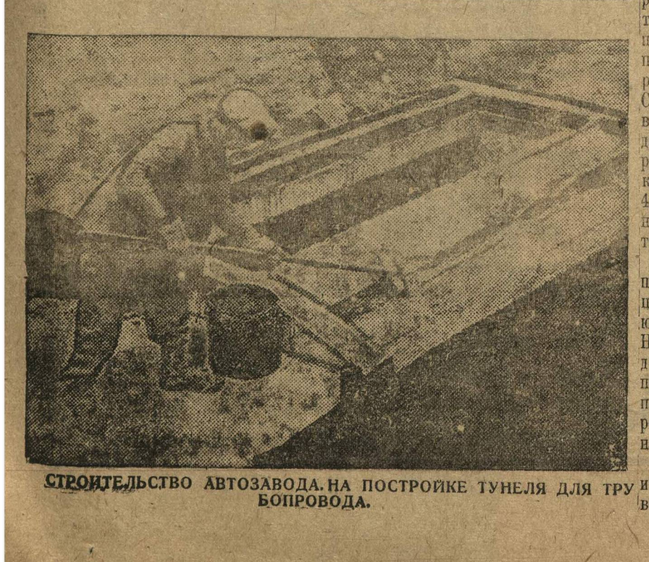
СТРОИТЕЛЬСТВО АВТОЗАВОДА НА ПОСТРОЙКЕ ТУНЕЛЯ ДЛЯ ТРУБОПРОВОДА.