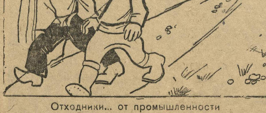
Отходники... от промышленности

Оршанский канком комсомоло мобилизовал на автострой 8 чел. и все они дезертировали. Дезертиры остались не наказанными.