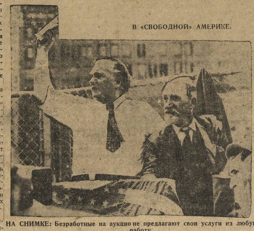
НА СНИМКЕ: Безработные на аукционе предлагают свои услуги из любую работу.