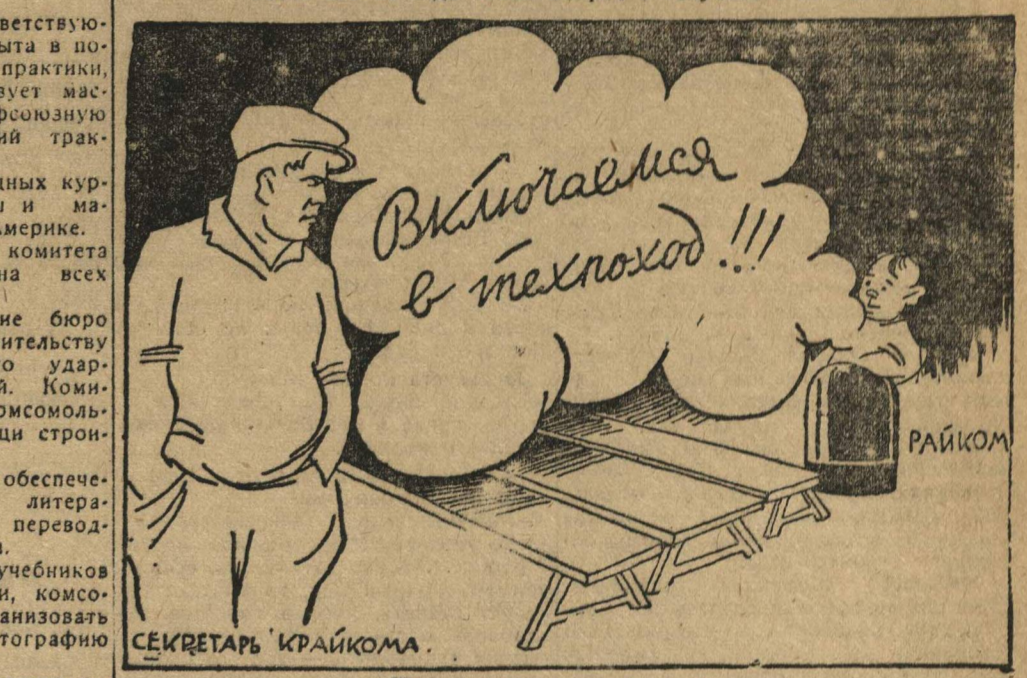
ПУСКАЮТ ДЫМ В ГЛАЗА

Техническая учеба в Выксунском районе за последние 2 месяца совершенно заброшена. Комсомольцы овладением техникой занимались только в заводской библиотеке, которая в последнее время переехала в заводской цех, и на новостройках, но и там было не так много времени, как раньше.