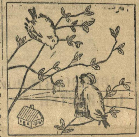
На птичьих правах

В Муромском районе, сняли со снабжения всех учителей.