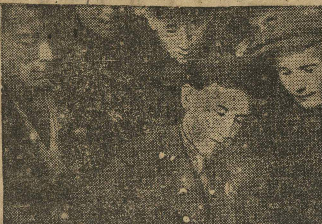
Призывники подписываются на танк «Призывник 1909 года».