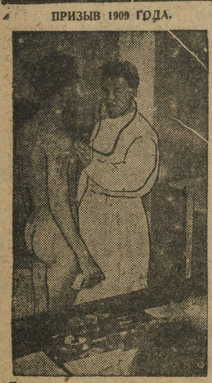
Призывники на медицинском осмотре.

Музыкально-театральной техники выслышит из занимаемого помещения, не предоставив нового.