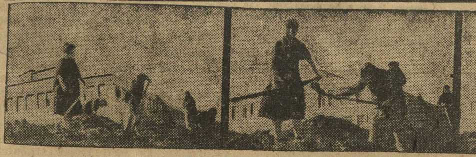
НА СТРОЙКЕ АВТОГИГАНТА. На субботнике.

Футбольный матч между норвежской командой и вятской сборной, закончился с результатом 3:2 в пользу Вятки.