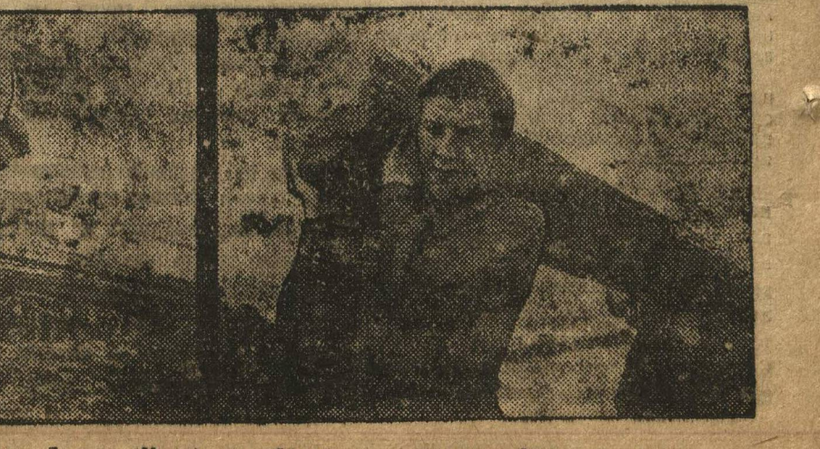
Работы телефонного звонка им. Ленина (Муром) на субботнике по расчистке балки в дубовом лесу.

Отделилась на призыв «Правды» в целях оздоровления санитарного состояния города, фабрик, заводов и общественных мест — Арзамаский горсовет объявил месячник очистки. В месячник широко вовлекается общественно-предоставляют совсем. Не думая и со стороны организации. Общественное питание не организовано. Рабочие железнодорожной ветки Дубовая — Мадары.