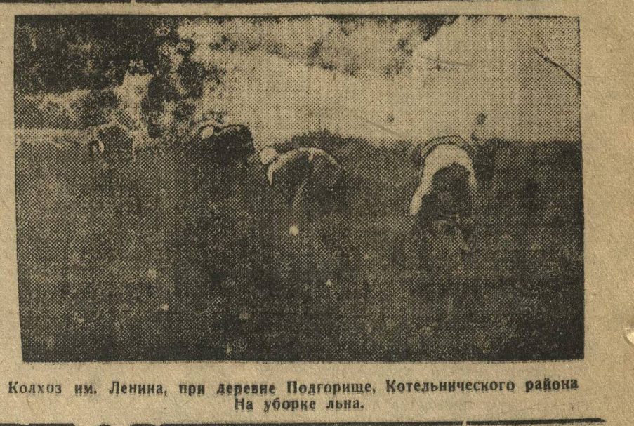
Колхоз им. Ленина, при деревне Подгорние, Котельничского района. На уборке льна.

10 сентября при Крайком ВЛКСМ состоялся совещание секретарей Горно-марийского, Кологривского, Мантуровского и Уренского районов. На совещании обсуждался вопрос об итогах сплава и летних лесозаготовках. Подводя итог сплава по леспромхозам ряда районов, можно отметить удовлетворительное положение. Лес сплавлен на 100 проц. За исключением рек Рутки и Ветлаги (Горно-марийский район), где сплав, произошедший только на 80 проц. Совсем другое положение с выполнением плана летних заготовок и подготовки к зимним. Несмотря на то, что план лесозаготовок 30-31 г. да был выполнен, лесотрансхозы ошибок прошлого года не учли и по боевому подготовке к лесозаготовкам не разберутся. Культурно-просветительная работа на лесозаготовках и лесозаготовках совершенно отсутствует. Рабочие клубы и красные уголки не оборудованы. Дело доходит до того, что красивые уголки превращаются в жилища и сущаяк (Кологривский район). Рабочим на Ореховом Яру (Горно-марийский район) больше месяца не доставлялось ни одной газеты. После этого не удивительно, что на отдельных участках орудуют кулацкие агенты.