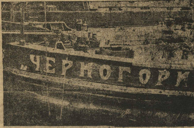
Аварийная баржа нефтевоз «Черногория», задерживается в ремонте из-за отсутствия капальных гвоздей. (Затон К. Маркса).

ВУРТ до сих пор еще не научился рационально использовать тоннаж. Писется не единичные факты, когда баржи ходят далеко неполностью загруженными. Так например, совершенно воюая баржа «Кура», стоящая под надзором у нефтеналивной машинки № 111, вместимостью в 3.700 тонн воюе пятый рейсом ходит вверх по Волге с грузом в 1.700 тонн. Недозгрузка барж на 2.000 тонн в каждом рейсе является результатом головоротских распоряжений ВУРТА. Эти головотские распоряжения распространяются на одну «куру» баржу низового Алеса ходит загруженной всего на одну треть. Мы ставим вопрос перед ВУРТом о немедленном выяснении конкретных виновников нерационального использования тоннажа. Сейчас в ударный период борьбы за выполнение программы нефтеперевозок весь тоннаж должен быть использован полной нагрузкой!