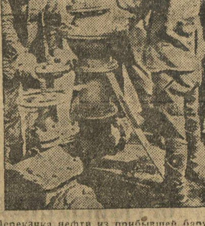
Перекатка нефти из прибывшей баржи «Видой», в машинки Нефтьсидальката Моховые горы.

На Бурнаковском участке постоянно работают 4 нефтеперекачечные машинки № 74, 75, 76, «Молот», временно 86-я. Использование этих машинок далеко не рационально.