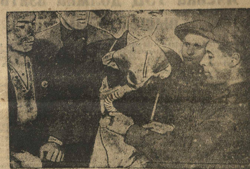
На призывном пункте Свердловского района. Призывники знакомятся с устройством противозага.