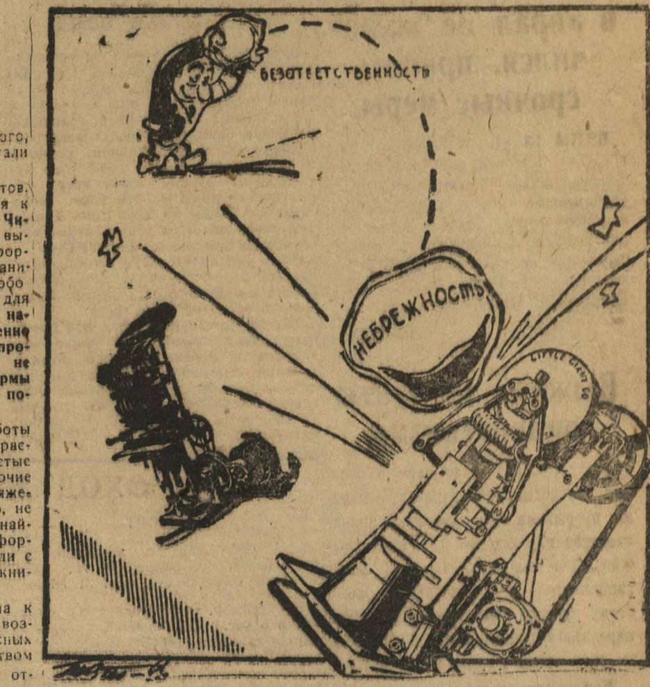
Шалости взрослых людей