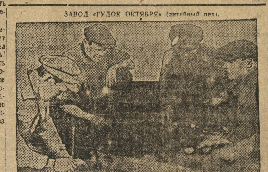
Завод «Гудок Октября» (лительный пех).

ОТВЕТСТВЕННЫЙ РЕДАКТОР К. ЗОТИН. ИЗДАТЕЛЬСТВО НИЖКОММУНЫ.