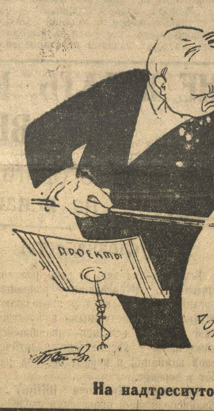
На надтреснутом инструменте

бастуют матросы двух германских пароходов. В Копенгагене команды 10 германских пароходов решили объявить забастовку. В Роттердаме начались забастовки команд двух германских пароходов. Во Фленсбурге забастовала команда одного парохода. Из Ленинграда получена телеграмма о том, что на 31 германском пароходе команды большинством 231 голосом против 10 решили начать забастовку и шлют привет матросам германских гаваней.