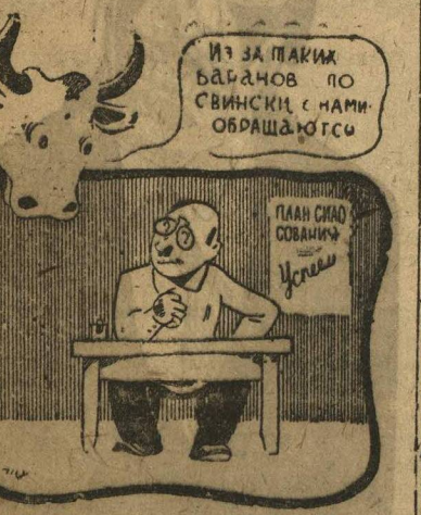
КОРОВЫ О БАРАНАХ.

План силосования по Вятскому району выполнен всего на 25 проц. Райколхозсоюз, Молжизсоюз, ГосЗУ бездействуют. Комсомол не возглавил борьбу за силос.