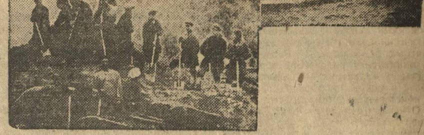
ВВЕРХУ: первая баржа с формовочной землей для литейного цеха автогиганта, отправленная 7 октября. ВНИЗУ: комсомольские отделения и выдвинувшая вступившая в работу по добыче 6 кубометров, против 5 по заданию.