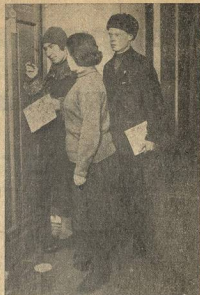
Обследовании обшечности культурной