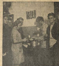
КОЛЛЕКТИВ НА ПОВРОВКЕ УНИИ РАЗДАЮТ...

Своим искренним протестом против уверток и лжи карьериста-кулака, совершено чуждого партии, собрание шло своей решительный приговор. Вряд ли выводы комиссии по чистке разойдутся с этим приговором.