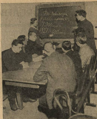
Занятия на курсах по подготовке рабочих, едущих в колхозы

Оспыным при этом был лозунг: «Поддержат все ревизию: и практику национальной политики и учение Маркса и Ленина». Так, на одном нелегальном собрании участники его пришли к выводу: