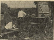
СТУДЕНТЫ-ЦИМОВЦЫ ЗА СБОРНОЙ СЕЛЬХОЗИНВЕНТАРЯ