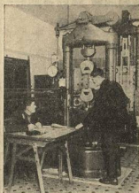
(ЗОЕННО-ВОЗД. АКАДЕМИЯ) ИСПЫТАНИЕ ОБРАЗЦА НА РАСТОЯНИИ ПРИ ПОМОЩИ 50-ТОННОЙ МАШИНЫ