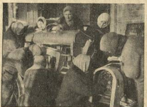
КУРСАНТЫ ЦЕНТРАЛЬНЫХ ТРАКТОРНЫХ КУРСОВ (МОСКВА)