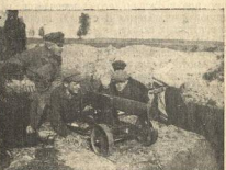
СТУДЕНТЫ ОМСКОГО ХУДОЖЕСТВЕННО-ПРОМ. ТЕХНИКУМА НА ЗАБЯТЯХ (ПУЛЕМЕТНАЯ КОМАНДА)