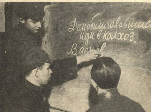
Будущие колхозники в Красной армии