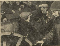
РАБОЧИЕ «ТР. БОГАТЫРЯ» НА ТРАКТОРНЫХ КУРСАХ