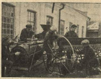
УДАРНАЯ БРИГАДА ПО РЕМОНТУ СЕЛЬХОЗМАШИН В БРЯНСКОМ ИНДУСТРИАЛЬНОМ ТЕХНИКУМЕ