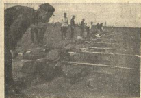
ЛЕНИНГР., СЕЛЬ/ХОЗ. ИНТ