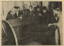
ЗА ВОЕННОЙ УЧЕБОЙ (ГОРНЫЙ ИНТ)