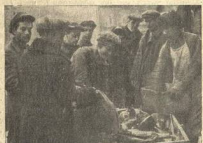
СТУДЕНТЫ ЗА СБОРОМ УТИЛЬСЫРЬЯ (МОСКВА)