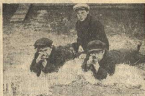
ЛЕНИНГР., СЕЛЬ/ХОЗ. ИНТ

Не ипать, а бороться, учиться, перестраивать педфак и все вузы, «сбор с мусорной ямы» превратить в лучший и нужный пролетарский вуз.