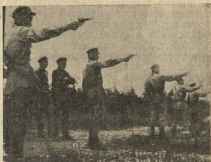
МЕНДЕЛЕЕВЦЫ УЧАТСЯ СТРЕЛЯТЬ ИЗ НАГАНОВ