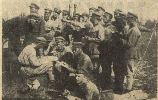
Менделеевцы в лагерях

* Главпрофобр внес на утверждение Совнаркома проект о реорганизации сибирского технологического института в политехнический институт. Помимо существующих факультетов создается транспортный факультет, горный факультет реорганизуется в три самостоятельных факультета: металлургический, рудничный и геолого-разведочный. В ближайшие годы число студентов увеличивается вдвое. Строится новое общежитие на 650 человек.