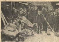
СБОР УТИЛЬСЫРЬЯ СТУДЕНТАМИ МЕНДЕЛЕЕВСКОГО ИН-ТА