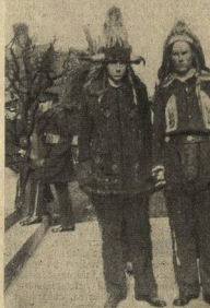
ИНДЕЙСКИЕ СТУДЕНТЫ ПЕРЕД ИГРОЙ В ФУТБОЛ

Физкультурники, отвоюйте право на физкультуру в вузе—эту лучшую страховку от болезни, от будущих неврастений, гемороев и прочей дряни.