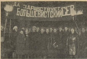
ДЕМОНСТРАЦИЯ АГРОНОМОВ, МОБИЛИЗОВАННЫХ В СЕЧЕТЬ 1950

В эти дни Тимирязевка походила на военный лагерь. Студенты забывали про сон и отдых. Штаб кампании давал приказ за приказом. Курсы, группы переклещивались с учебю на ударную подготовку к севу. По многолюдным станциям кипела практическая работа. Гремели вельжик, триеры, звенело железо тракторов, плугов. Все разбиралось по винтику, подробно изучалось для того, чтобы не слыховать на зачете перед лицом колхозной деревни. Не забывали и о теоретическом оружии. Решения ноябрьского пленума ЦК ВКП(б), колхозное движение — вопросы по всей полноте были проработаны в группах. В две недели изменился облик тимирязевца: он стал «агро-красноармей-